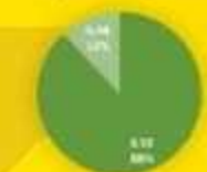
Sarana Pengaduan dan Respon Pengaduan